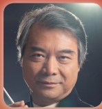
指揮 Conductor 閻惠昌 YAN Huichang

禪院鐘聲 The Sound of Music Tonight 大海啊故鄉 你的名字我的姓氏 彩雲追月