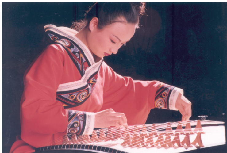
圖 8-9：瑟的演奏和江蘇徐州北洞山漢墓陶樂俑的撫瑟姿態