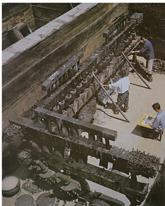
湖北隨州曾侯乙墓編鐘出土現場

隨著中國科學考古的發展，更多與音樂相關的重大發現帶來了音樂考古學的快速成長，音樂考古學的研究物件，是各個歷史時期人們音樂活動所遺留下的各種遺物和遺跡。音樂考古學根據這些考古發現和發掘的實物資料，以考古學的方法，闡明古人音樂實踐活動，進而探討音樂文化的發展，是考古學的一個分支。有關音樂的遺存一般分為器物和圖像兩大部分，器物主要是各種質地的樂器類。而圖像則如樂俑、與音樂藝術活動有關的器物銘文，各種器物繪飾、堆塑、雕磚石刻、洞窟壁畫以及涉及音樂內容的圖書、樂譜等，內容廣泛。音樂考古學與人類各種族的音樂活動、和文字記載的音樂活動同樣有密切的關係。近年來，科學技術更多的進入到音樂考古的領域，有關樂器的年代測定法，青銅樂鐘與冶金學、古代樂器的錄測音中所涉及的現代音響學問題，都隨著音樂考古學的研究深入而越來越受到人們的關注，在這其中，實驗考古學對於音樂考古成果的研究顯得更為重要。從無聲到有聲，使得過去停留於古代文獻的音樂歷史，成為了一門充滿魅力的學科。隨著古代音樂文物的絡繹出土，中華民族音樂發展史被這一次次欣喜地發現而改寫。它摒棄了中國音樂起源的神話學支撐，結束了有關上古五聲音階和七聲音階起源的爭論，更新對中國古代樂律水準的認識，打破了音樂史治史的文獻史料的局限。這些音樂文物是古代樂音的真實載體，凝結著中國上古旋律和音容的全部秘密。為解開這些謎團，復活遠古滅絕的藝術，建立富有生命力的音樂博物館，音樂考古的音響實驗成為實現這一理想的學術階梯，以重寫全新的中國古代音樂史。