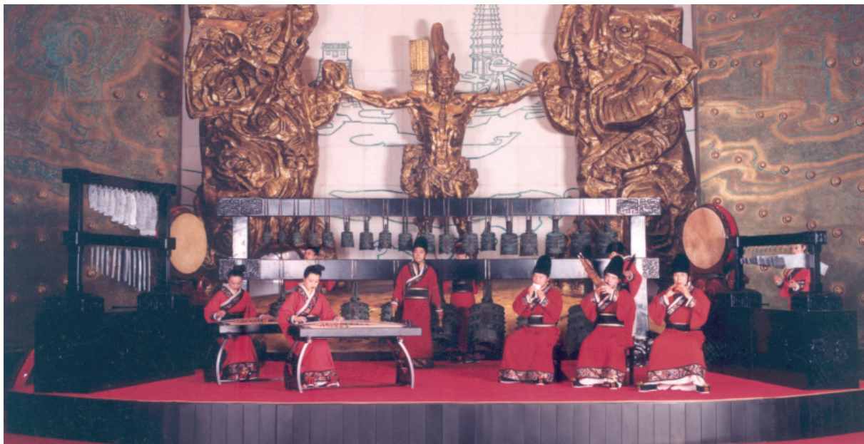
河南博物院華夏古樂團演出場景

華夏古樂團一開始就與音樂學界專家合作，將博物館的靜態文物展示模式，引入動態的展演之中，把古樂與文物的展示結合，突出河南省歷史悠久、文物豐富的特點，強調音樂文物的復原研究，因此我們所使用的每一件樂器的復原與演奏，都會在考古資料中找到堅實的學術依據。而作為陳展的延伸的演出風格，將音樂文物的展示與解說，曲目的演出與文化背景的解說相結合。既展覽又講解，並與演奏相輔相成，有別於一般的藝術演出，而以音樂文化傳播為己任。在日常演出的同時，走入學校，舉辦假日講座，在專題音樂會的籌備上，認真選擇主題，歷史階段為縱向脈絡，以人文風格為橫向意象，將音樂與歷史文化、音樂與古典文學、音樂與傳統審美匯融一體，從而建立起華夏古樂的意境，給每一位面對它的觀眾以全方位的強烈的傳統美的衝擊。