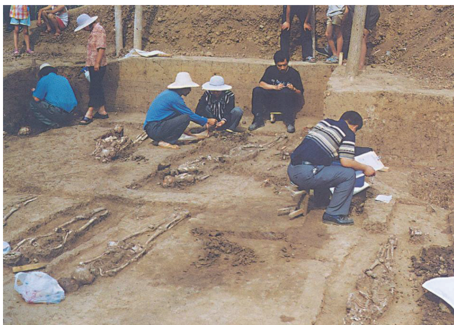
河南舞陽新石器時代賈湖遺址的考古發掘現場

我們不能低估遠古人類的音樂水準，他們的生活空間，沒有人為的噪音，而更多大自然美妙和諧的聲音。反而我們現代人對樂音的感覺能力在下降。骨笛經專家測音，該遺址早期的四、五孔骨笛（西元前7000-6600年左右）已經能奏出四聲音階和完備的五聲音階。中期的（西元前6600-6200年左右）的七孔骨笛，能奏出六聲和接近七聲的音階。而遺址晚期（西元前6200-5800年左右）的骨笛分別鑽有8孔、9孔，能奏出完整的七聲音階以及七聲音階以外的一些變化音。經鑒定，賈湖骨笛是用鶴類動物的尺骨鋸去兩端關節鑽孔而成。製笛之前賈湖人曾經認真計算，在骨管上刻劃等分記